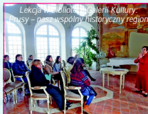
Lekcja w Muzeum Galerii Kultury „Prusy – nasz wspólny historyczny region”