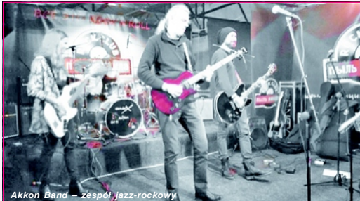
Akkon Band – zespół jazz-rockowy