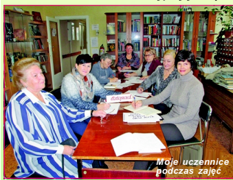
Moje uczennice podczas zajęć