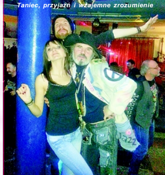
Taniec, przyjaźń i wzajemne zrozumienie

wadzone „ROCK Marathon Partizanskoje” w 2014 roku i „Rock Marathon Kowrowo” w 2015 roku, międzynarodowe kursy mistrzowskie w