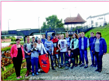
Lekcja przy udziale grup rekonstrukcyjnych w Malborku

Zorganizowano również dwie „żywe” lekcje historii dla młodzieży z Kaliningradzkiego College'u i Rybolowstwa i Przelotwstwa. Zajęcia odbyły się na zamku malborskim oraz lidzbarskim. Były połączone ze zwiedzaniem miast oraz spotkaniami z przedstawicielami lokalnych