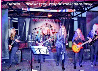
Euforia – dziewczęcy zespół rockandrollowy

kach i współpracy, kilka zespołów po obu stronach koncertują w sąsiedów. Dzięki tej współpracy w ramach międzynarodowego programu „Kultura bez granic” zostały pomyslnie przepro-