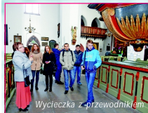
Wycieczka z przewodnikiem