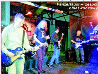
Panzerfaust – zespół blues-rockowy

festiwalach w charakterze króla Rzeczpospolitej.