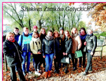
Szlakiem Zamków Gotyckich