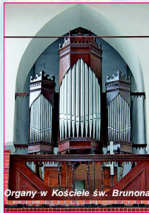
Organy w Kościele św. Brunona