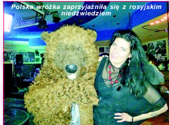
Polska wózka zaprzyjaźniła się z rosyjskim niedzwiadkiem

„Pyl Winylu” to miejsce, gdzie gromadzą się prawdziwi miłośnicy dobrej muzyki, nie tylko młodzież, ale także starsze pokolenie. Dlatego na koncert przyszło wielu wczorajszych i dzisiejszych muzyków z całego Obwodu Kaliningradzkiego, grających na gitarze dziewczyn, miłośników jazz-rocka, a także ludzie, którzy są uzależnieni od języka polskiego. Na zaproszenie administracji Klubu przybyli przedstawiciele Konsulatu Generalnego RP w Kaliningradzie, a także czasopisma „Głos znad Pregoly”.