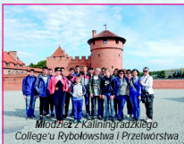
Młodzież z Kaliningradzkiego College'u i Rybolowstwa i Przelotwstwa