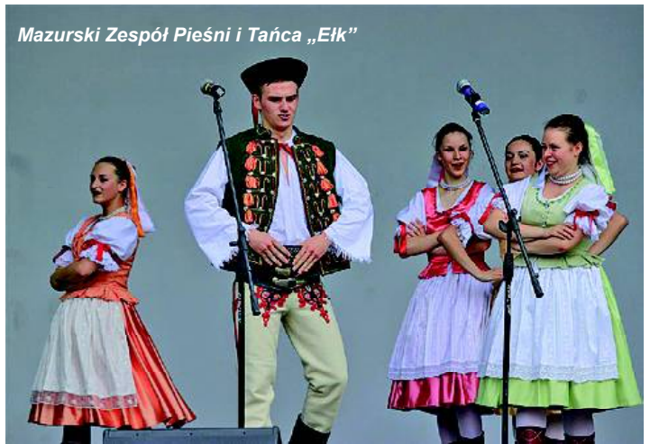
Mazurski Zespół Pieśni i Tańca „Elk”

Na zakończenie sobotniej uro- czystości wystąpił Mazurski Zes- pól Pieśni i Tańca „Elk”, laureat Ogólnopolskich Przeglądów Fol-