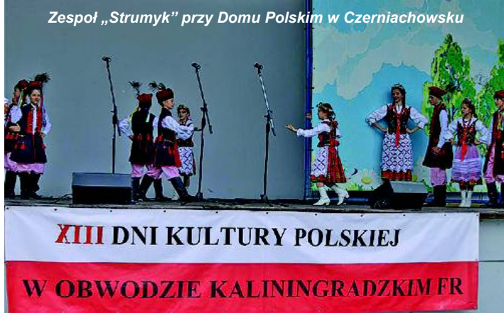
Zespół „Strumyk” przy Domu Polskim w Czerniachowsku

klorystycznych. Zespół ten posia- da weryfikację przyznaną przez Międzynarodową Radę Stowa- rzyszeń Folklorystycznych Festi- wali Sztuki Ludowej uprawniają- cą do reprezentowania polskiej kultury za granicą.