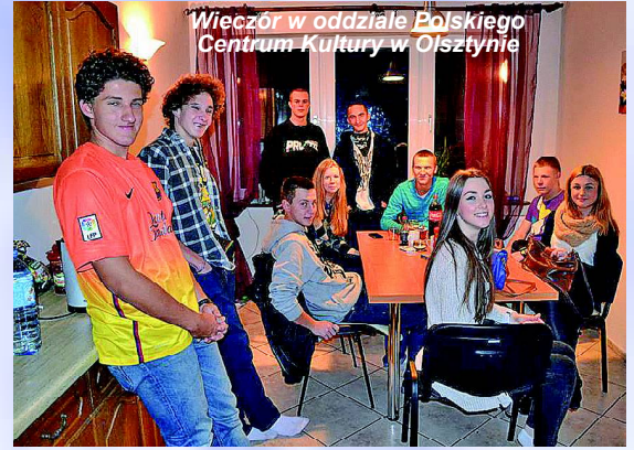
Wieczór w oddziale Polskiego Centrum Kultury w Olsztynie

nia swojej znajomości języka polskiego, mają również możliwość spróbowania samodzielnego życia z dala od rodzicielskiego domu, a przecież w ta-