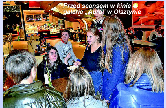
Przed seansem w kinie galeria „Aurora” w Olsztynie

Projekt jest finansowany w ramach funduszy polonijnych Ministerstwa Spraw Zagranicznych Rzeczypospolitej Polskiej.