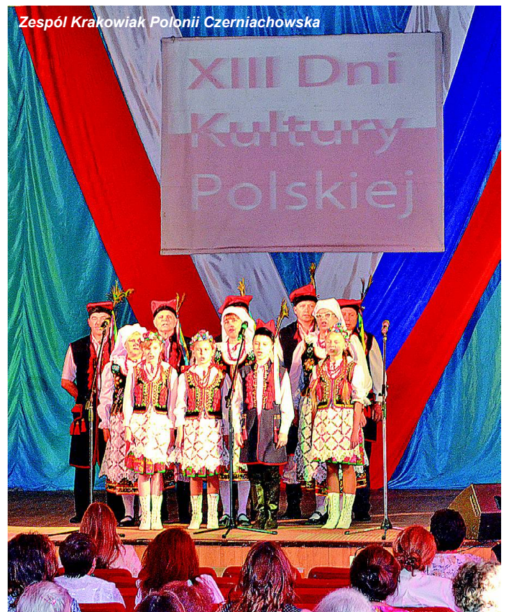
Zespół Krakowiak Polonii Czerniachowska

W piątek 23 maja rozegrano mecz piłki nożnej na stadionie