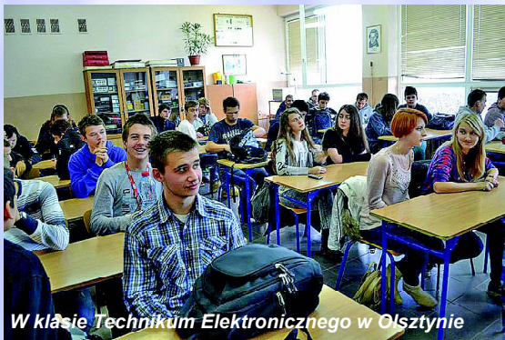
W klasie Technikum Elektronicznego w Olsztynie

kich warunkach większość z nich być może znajdzie się za rok czy dwa, rozpoczynając swo-