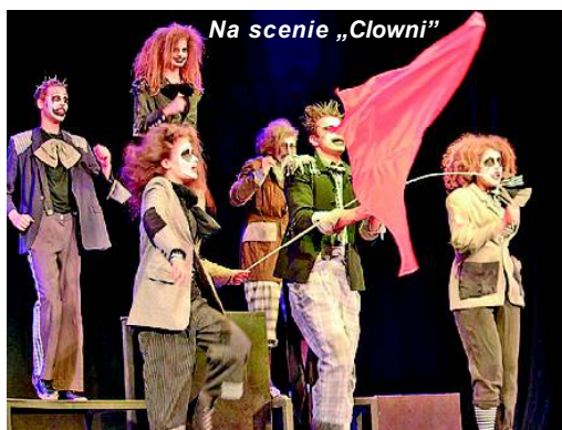
Na scenie „Clowni”