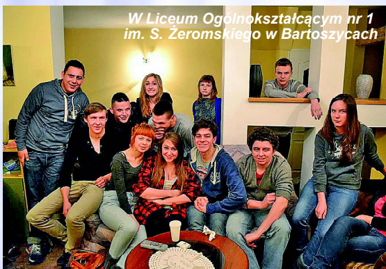
W Liceum Ogólnokształcącym nr 1 im. S. Żeromskiego w Bartoszycach

Tego lata, w lipcu grupa młodzieży nie tylko z Kaliningradu, ale również z Ukrainy i Białorusi ponow-