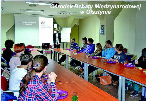
Ośrodek Debaty Międzynarodowej w Olsztynie

go, mogą też nawiązywać nowe znajomości i przy-