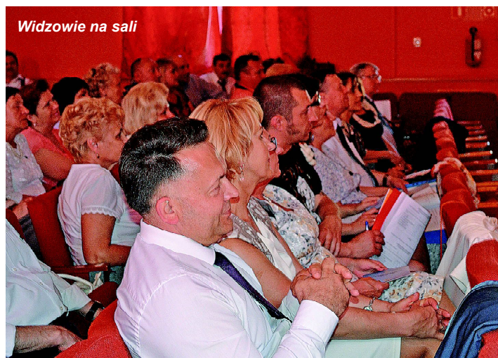
Widzowie na sali

polonijnym, zaczęła występ twórczych zespołów Wspólnoty Polonijnej „Dom Polski” w Czernia-