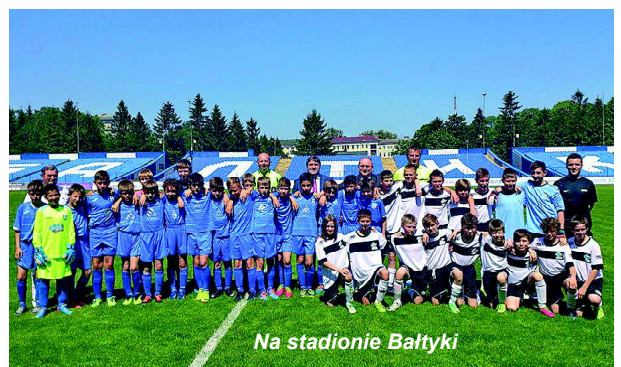
Na stadionie Bałtyki