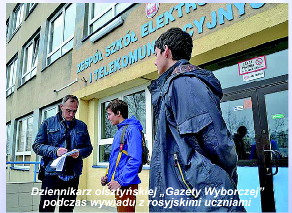
Dziennikarz olsztyńskiej „Gazety Wyborczej” podczas wywiadu z rosyjskimi uczniami