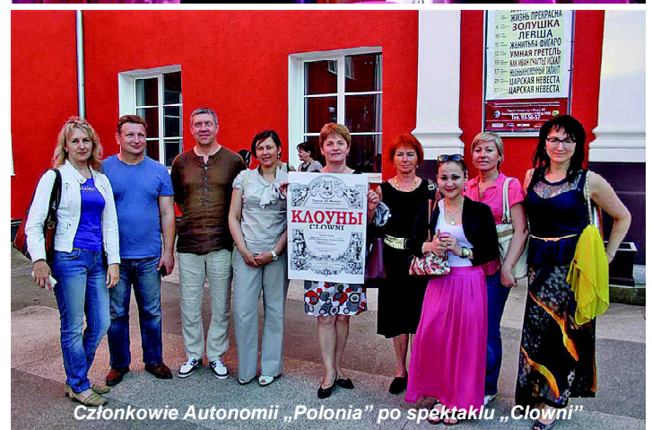
Członkowie Autonomii „Polonia” po spektaklu „Clowni”