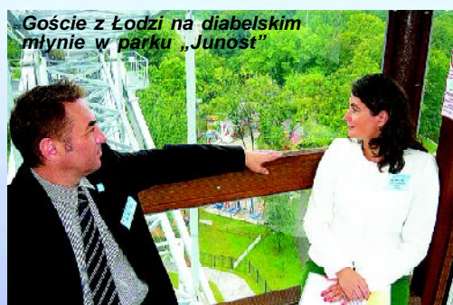
Goście z Łodzi na diabelskim młynie w parku „Junost”