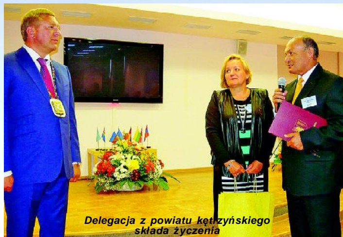
Delegacja z powiatu kętrzyńskiego składa życzenia

Razem w przedsięwzięciach świątecznych wzięły udział delegacje z 22 miast partnerskich Kaliningradu z Polski, Rosji (Moskwa, Omsk), Białorusi (Brześć, Grodno), Armenii (Erywań), Litwy (Wilno, Kowno, Poniewież, Szawle) i Niemiec (Bonn, Bremerhaven, Hamburg, Rostock). Wśród gości honorowych był Konsul Generalny Federacji Rosyjskiej w