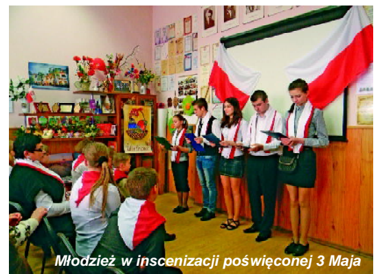
Młodzież w inscenizacji poświęconej 3 Maja