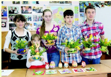
Wykonane przez dzieci ozdoby świąteczne