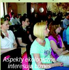
Aspekty ekologiczne interesują biznes

W zorganizowanym w Gołdapi przez Starostwo Powiatowe III międzynarodowym spotkaniu polskich i rosyjskich przedsiębiorców „Biznes ponad granicami” wzięło udział ponad 70 osób (przy wsparciu Polskiej Agencji Rozwoju Przedsiębiorczości w Warszawie, Fundacji Wspierania Przedsiębiorczości Regionalnej w Gołdapi oraz Urzędu rejonu Gusiew i Fundacji