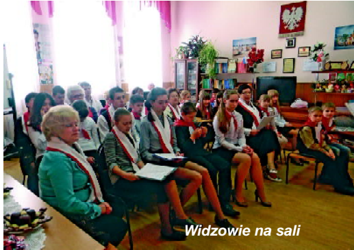
Widzowie na sali

teśmy rodziną i mamy co powiedzieć sobie nawzajem.