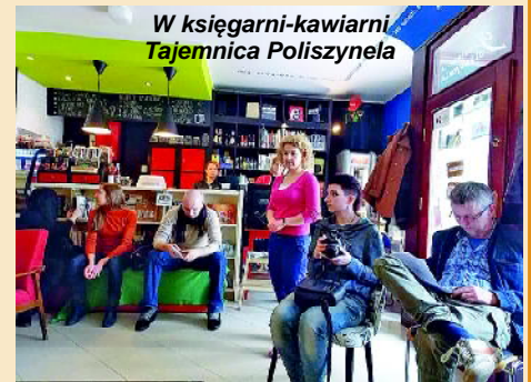
W księgarni-kawiarni Tajemnica Poliszynela

Program wizyty studyjnej na Warmii i Mazurach, na terenach nominowanych do konkursu na jeden z Nowych 7 Cudów Natury, nie mógł pominąć walorów turystyczno-krajoznawczych regionu. Podczas pobytu dziennikarze spędzili