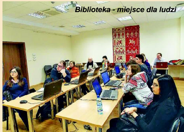
Biblioteka - miejsce dla ludzi

Dziennikarze w ramach Programu Study Tours to Poland dla profesjonalistów mieli możliwość zapoznania się ze światem mediów Warmii i Mazur, nawiązania kontaktów z polskimi kolegami, odbycia wielu ciekawych spotkań z prawdziwie interesującymi ludźmi.