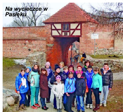
Na wycieczce w Pasłęku