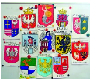
Herby państwowe polskich miast, wykonane przez dzieci

3 Maja 1791r. Polski Sejm nazywany Wielkim, uchwalił w Warszawie Konstytucję, która zapewniała równe prawa wszystkim obywatelom. Była to pierwsza w Europie konstytucja, oparta na najlepszych, demokratycznych zasadach. Przez wszystkie późniejsze lata niewoli 3 Maja pozostał naszą narodową świętością, wspomnieniem