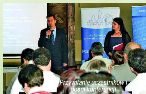
Przywitanie uczestników i gości konferencji

CPMSP Rejonu Gusiew i przy udziale przedstawicieli Wspólnoty Kultury Polskiej w Gusiewie). Dwa poprzednie spotkania odbyły się w marcu w Gołdapi i w lipcu w