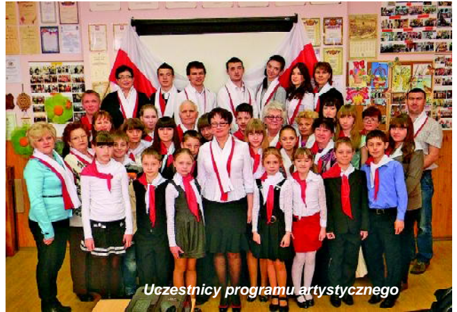
Uczestnicy programu artystycznego

Jesteśmy pewni, że takie spotkania nie tylko pogłębiają wiedzę o historii Polski, ale jeszcze łączą pokolenia Polaków w Czerniachowsku z Ojczyzną. Potem obejrzelśmy film o historii Polski i film, poświęcony 3 Maja. Później przenieśliśmy się do stołu z poczęstunkiem i jeszcze długo nie rozchodziliśmy się, bo jes-