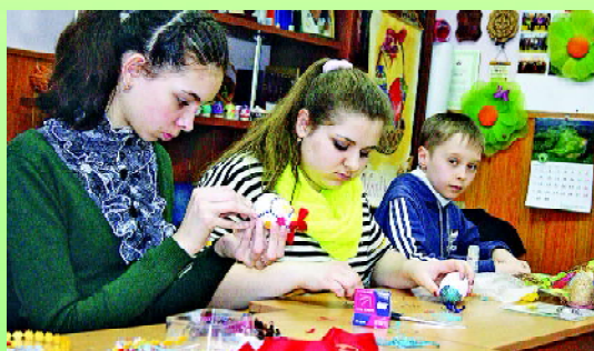
Na zajęciach z kultury

przekazywaniem informacji o zwyczajach i tradycjach wielkanocnych i związane były z nauką robienia świątecznych dekoracji i ozdób. Na zajęciach wokalnych razem śpiewaliśmy polskie pieśni. Niezwykła też była multimedialna wędrowka po Warmii i Mazurach – prezentacja najciekawszych miejsc w regionie.