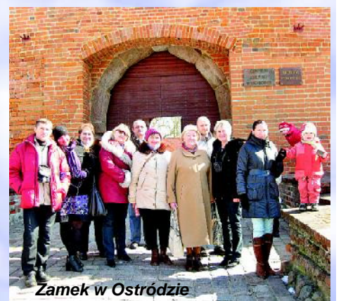
Zamek w Ostródzie

Trwające ponad dwie godziny spotkanie zakończyło się nagrodzeniem 10 uczestników szarfami z napisem „Mistrz” i podaniem w jakiej dziedzinie. Uczestnicy zabawy już czekają na kolejne spotkania.