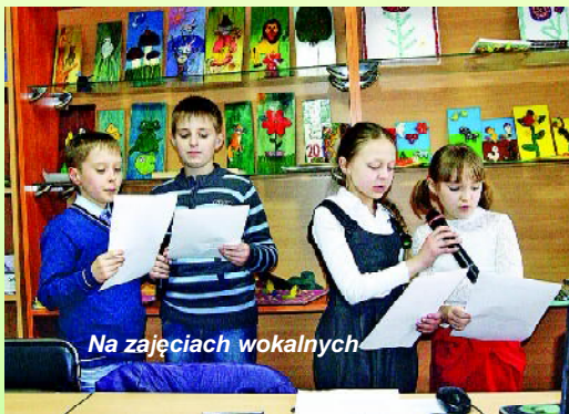
Na zajęciach wokalnych