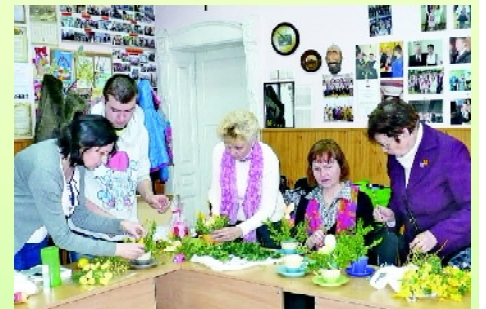
Przekazywanie nauki robienia dekoracji

„Niezwykle ciepło będziemy wspominać pobyt w Czerniachowsku. Wspaniała atmosfera, zaangażowanie naszych gospodarzy i ich podopiecznych w kultywowanie polskich tradycji,