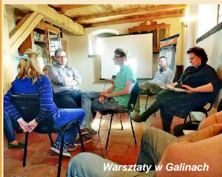
Warsztaty w Galinach

Rozpoczęło się prezentacją Borussia – Cent-