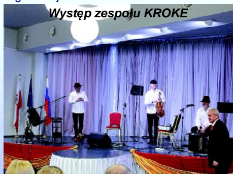
Występ zespołu KROKE

Polacy słyną jako naród, który bardzo pielęgnuje tradycje i obyczaje. Do Konsulatu byli zaproszeni przedstawiciele różnych organizacji i uczelni.