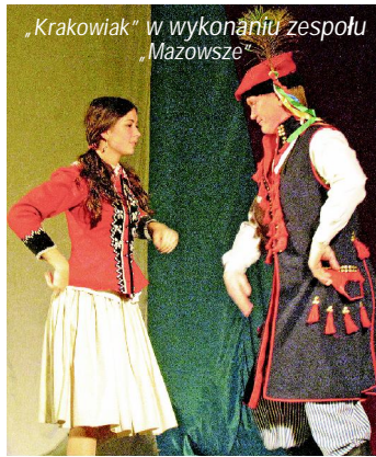
„Krakowiak” w wykonaniu zespołu „Mazowsze”