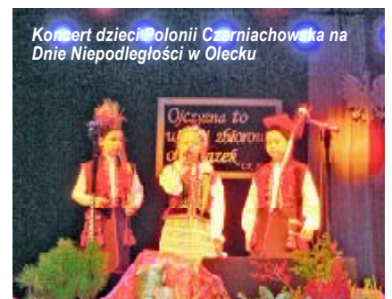
Koncert dzieci Polonii Czerniachowska na Dnie Niepodległości w Olecku

Najważniejsze jest to, że w taki ważny dzień mieliśmy możliwość uczczenia Niepodległości i Wolności Polski razem z Rodakami. Kochamy swoją Polskę, wychowujemy nasze dzieci w tej miłości, nie zapominamy o bohaterach i