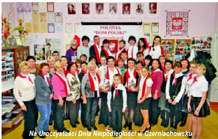
Na Uroczystości Dnia Niepodległości w Czerniachowsku