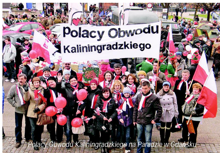
Polacy Obwodu Kaliningradzkiego na Paradzie w Gdańsku

Członkowie Stowarzyszenia Polonijnego „Dom Polski” im. F. Chopina w Czerniachowsku zgromadzili się w gabinecie języka polskiego szkoły nr 6, aby wspólnie uczcić 94. rocznicę odzyskania przez Polskę Niepodległości. Uczyniliśmy ten dzień refleksją nad historią i współczes-