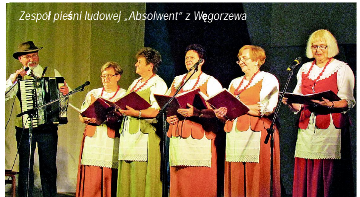
Zespół pieśni ludowej „Absolwent” z Węgorzewa

Regionalnego Domu Kultury była pełna ludzi, oprócz organizacji polonijnych Obwodu Kaliningradzkiego i gości, mieszkańcy miasta Czerniachowska też byli zainteresowani polską historią i kulturą.