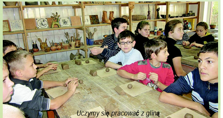
Uczymy się pracować z gliną

dachem. Bardzo dużo dowiedzieliśmy się o życiu prostych ludzi, o zwykłych, na pierwszy rzut oka przedmiotach ludzkiego bytu o niezwykłej historii, które ewaluowały na przestrzeni wielu lat.