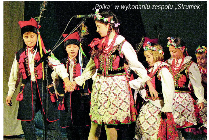
„Polka” w wykonaniu zespołu „Strumek”