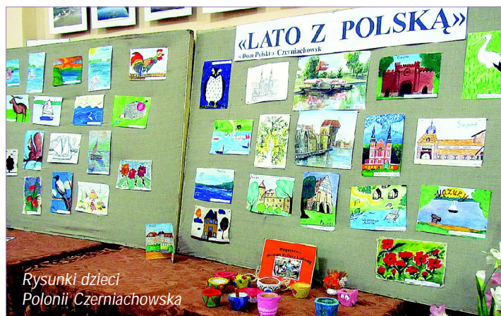
Rysunki dzieci Polonii Czerniachowska

Msza Święta w Kościele Św. Brunona z Kwerfurtu odbyła się