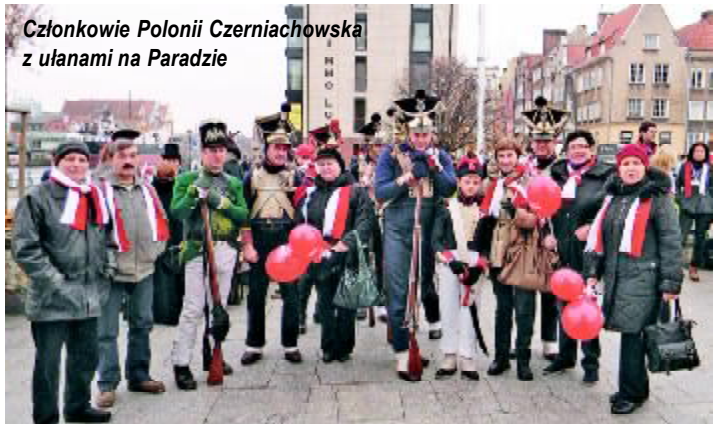
Członkowie Polonii Czerniachowska z ułanami na Paradzie