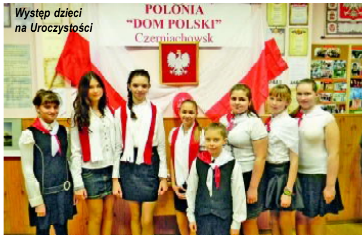
Występ dzieci na Uroczystości

rócz tego wyjeżdżaliśmy na wycieczkę do „Wenecji Północy” Augustowa, gdzie podziwialiśmy Kanał Augustowski. Zachwycaliśmy się również nietypową architekturą Ełku i obejrzelśmy rodzinne miasto Marii Konopnickiej – Su-