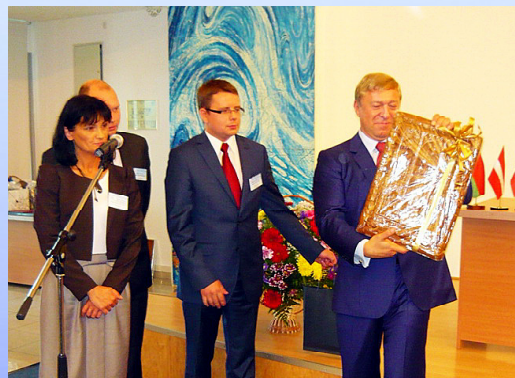
Piernik z Torunia

Jeśli wziąć pod uwagę fakt, że w ciągu dwóch świątecznych dni w Katedrze na wyspie I. Kanta odbywał się tradycyjny międzynarodowy konkurs organistów im. M. Tariwerdijewa, to Kaliningrad ma szansę niedługo stać się muzyczną stolicą Południowego Bałtyku.