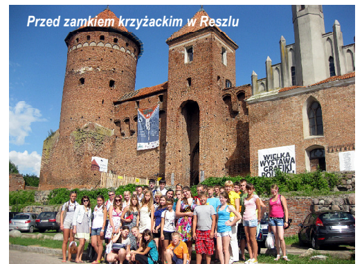
Przed zamkiem krzyżackim w Reszła

W trakcie turnusu organizowano wycieczki do Olsztyna, Giżycka, Reszła, Świętej Lipki, Węgorzewa i Srokowa. Szczególnym zainteresowaniem cieszył się Park Linowy na nieukończonyj służbie Leśniewo na Kanale Mazurskim. Młodzież miała możliwość sprawdzenia swoich sił