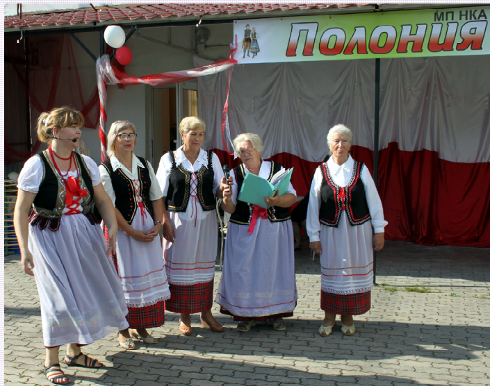
Chór Polonii Kaliningradzkiej

W dniu 28 sierpnia o godzinie 14 w kościele p. w. św. Wojciecha przy ul. A. Newskiego odsłuzono specjalną Mszę świętą w intencji kaliningradzkiej Polonii. Następnie