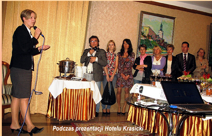
Podczas prezentacji Hotelu Krasicki