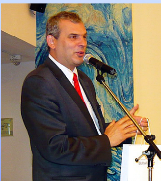
Pozdrowienia z Białegostoku