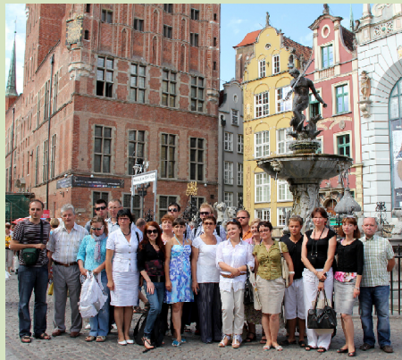
Wspólne zdjęcie w Gdańsku