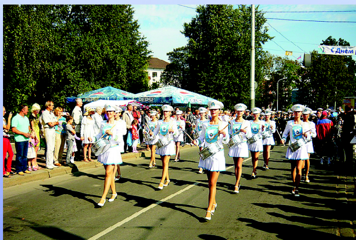
Pochód świąteczny po ulicach miasta