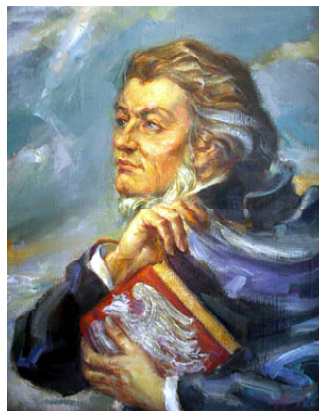
Portret A. Mickiewicza