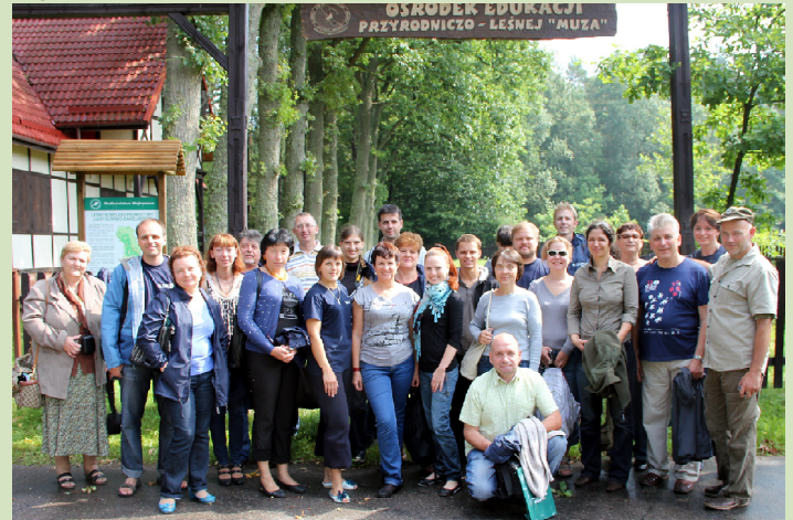
Uczestnicy wizyty studyjnej „Czas na ekologię” w Ośrodku Edukacji Przyrodniczo-Leśnej „Muza”