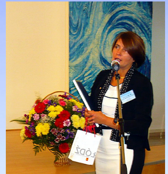
Pozdrowienia z Łodzi

Ukoronowaniem święta zgodnie z tradycją był majestatyczny piętnastominutowy pokaz sztucznych ogni, który można