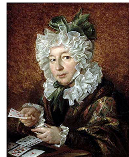
Kobieta układająca pasjansa