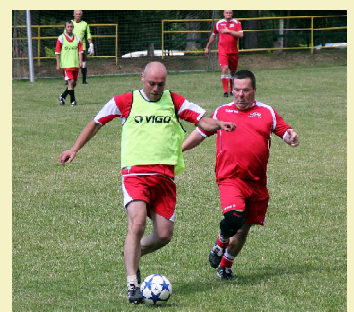
Fragment gry drużyny piłkarskiej z Primorska