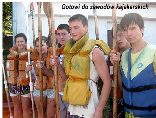
Gotowi do zawodów kajakarskich

Finałem turnusu był Festiwal „Foto MY” i wystawa prac twórczych „Stop Klatka”.