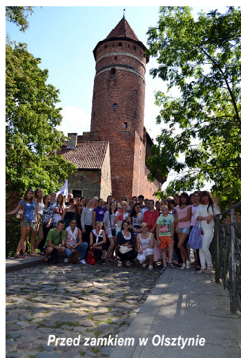
Przed zamkiem w Olsztynie