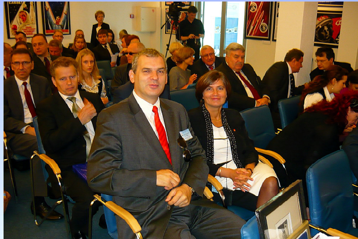
W Muzeum oceanu światowego

– z tym miastem tego dnia również podpisano protokół współpracy – obiecał, że jego miasto