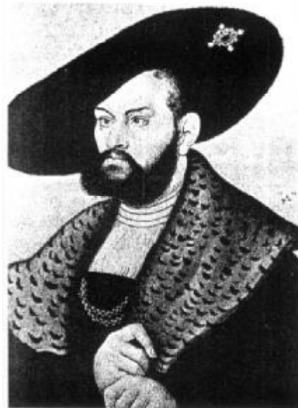
Książę Albrecht. Portret Łukasza Cranacha Starszego (1528).

odpowiednich śpiewników pieśni duchownych i nawet napisał chorał „Wszystko będzie tak, jak tego chce Pan”.