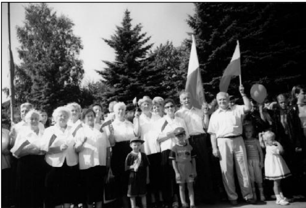
Na Centralnym Placu Zielenogradzka.

Natomiast około godz. 14 widzowie wraz z uczestnikami festynu przenieśli się do położonego wprost naprzeciw nadbrzeża morskiego placu «Róża Wiatrów», gdzie odbył się wielki koncert galowy przerożnych amatorskich zespołów artystycznych. Ze sceny nad morzem brzmiały obok rosyjskich ukraińskie pieśni, białoruska muzyka ,