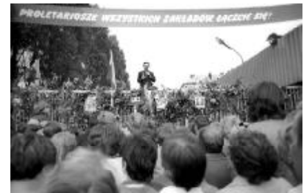
Strajk w Stoczni Gdańskiej w sierpniu 1980 r.

Niezależny Samorządny Związek Zawodowy «Solidarność» i powołano