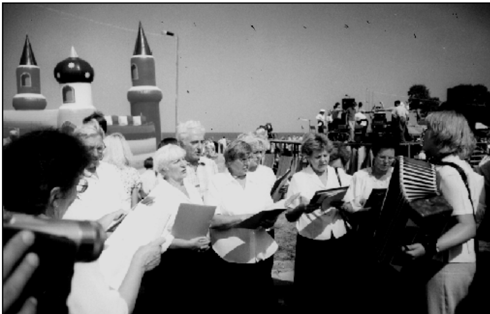
Ostatnia próba przed występem.