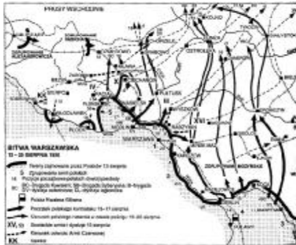
Plan bitwy warszawskiej 13-25 sierpnia 1920 r.

Tuchaczewski, mając zdecydowaną przewagę sił i będąc pewnym sukcesu, przed rozpoczęciem ofensywy, wydał rozkaz: «Na zachodzie ważą się losy wszechświatowej rewolucji - po trupie Polski wiedzie droga do wszechświatowego pożaru [...] Na Wilno - Mińsk - Warszawę - marsz!». Urzędujący już w Białymstoku Tymczasowy Komitet Rewolucyjny Polski z Marchlewskim i Dzierżyńskim miał się zająć wykonaniem leninowskiego planu sowietyzacji Polski. Bitwę stoczono od 13 do 25 sierpnia. Była przeprowadzona zgodnie z planem operacyjnym opracowanym wg koncepcji Marszałka Józefa Piłsudskiego i szefa Sztabu Generalnego generała Tadeusza Rozwadowskiego. W Bitwie