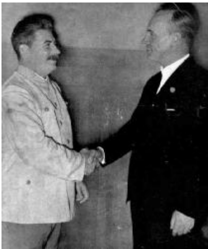
Minister Spraw Zagranicznych Niemiec - Joachim von Ribbentrop z Józefem Stalinem po podpisaniu niemiecko-radzieckiego paktu o nieagresji 23.08.1939 r.

Tragedia Polaków w II wojnie światowej rozpoczęła się już 23 sierpnia 1939 r. zawartym przez Związek Radziecki i Niemcy traktatem o nieagresji. Zakładał on likwidację państwa polskiego. Konsekwencją zawartego porozumienia, zwanego paktem Ribbentrop-Mołotow, była