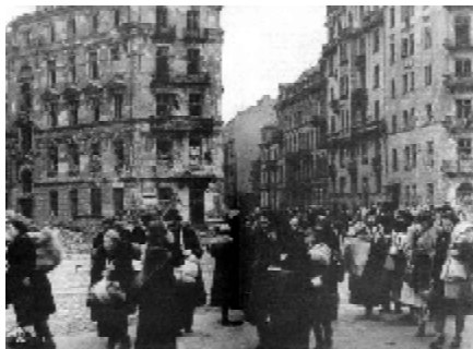
Ludność opuszcza Warszawę po powstaniu - październik 1944.

Z drugiej strony były plany bolszewików, którzy traktowali rozszerzenie rewolucji na Europę jako swoją misję. Lenin i inni przywódcy komunizmu w Rosji byli przekonani, że stoją w obliczu wielkiej rewolucji, którą trzeba przyspieszyć poprzez interwencję Armii Czerwonej. W Niemczech po ich klęsce w I wojnie światowej wybuchały zamieszki rewolucyjne, a najkrótsza droga do Niemiec prowadziła przez Polskę. W pierwszej połowie czerwca 1920 r. 1. Armia Konna marszałka Siemiona Budionnego przerwała front na Ukrainie, zmuszając wojska polskie do odwrotu. Dowódca sił Frontu Zachodniego, marszałek Michaił