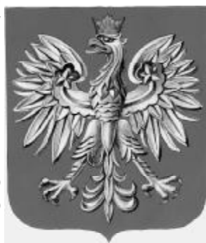
Herb Rzeczypospolitej Polskiej według oficjalnego wzoru z 1990 r.

Orzeł w herbie PRL nie nosił korony, ale pamięć Orła Białego w koronie nadal istniała w świadomości społeczeństwa, trwale przywiązanego do tradycyjnych narodowych symboli. Dobitnie ujawniły to protesty strajkowe na początku lat osiemdziesiątych, skierowane również przeciwko wypieraniu z życia zbiorowego Polaków ich narodowych wartości. Orzeł Biały w koronie towarzyszył wielkiemu ruchowi «Solidarności». Inne opozycyjne ugrupowania i partie przyjęły również znak Orła w koronie.