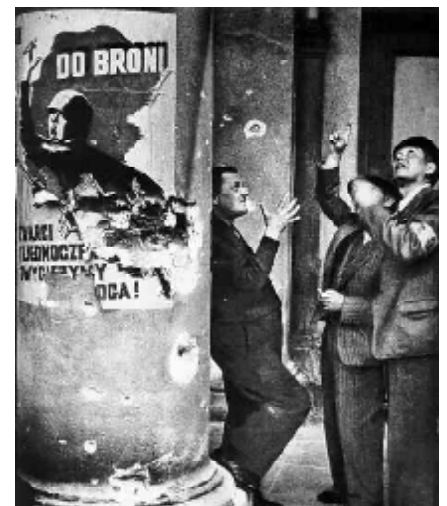
W trakcie niemieckiego nalotu na Warszawę - wrzesień 1939 r.