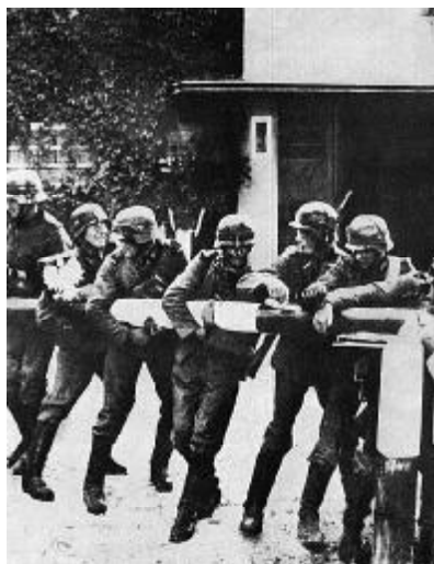
1 września 1939 r. - żołnierze niemieccy na granicy z Polską.

agresja na Polskę przeprowadzona z dwóch stron. 1 września 1939 roku z zachodu zaatakowali Niemcy i gdy jeszcze Polacy bronili się przed nimi, 17 września 1939 r. uderzyli Rosjanie. W radzieckiej akcji przeciw Polsce wzięło udział ok. pół miliona żołnierzy. Ten atak od wschodu przesądził o klęsce polskich sił zbrojnych przed ewentualną pomocą Francji i Anglii, które 3 września wypowiedziały Trzeciej Rzeszy wojnę i przekształciły ten konflikt w wojnę światową. Wódz naczelny wojsk polskich Edward Rydz-Śmigły z uwagi na beznadziejność sytuacji wydał wtedy rozkaz - nie walczyć z Sowietami. „Trzeba zacisnąć zęby i przetrwać. Położenie się zmieni. Wojna jeszcze trwa.