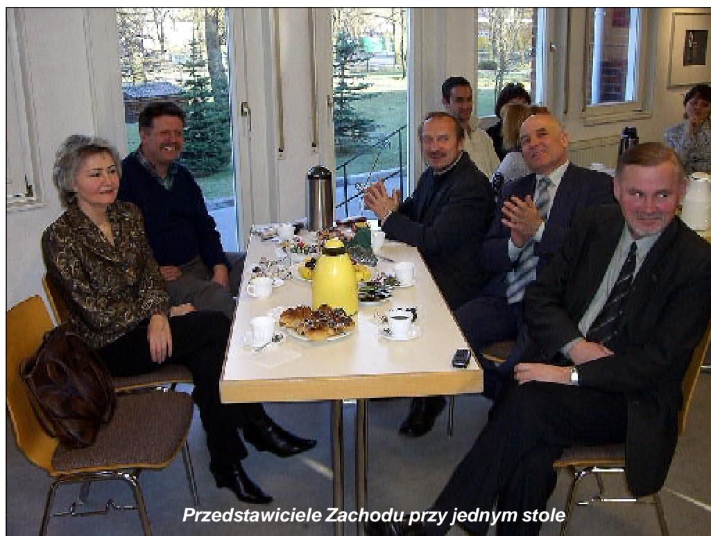
Przedstawiciele Zachodu przy jednym stole

Litwin Norkus Bronius powiedział kilka słów o