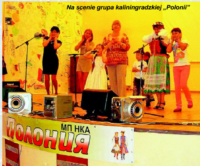
Na scenie grupa kaliningradzkiej „Polonii”