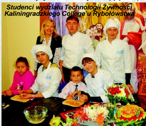
Studenci wydziału Technologii Żywności Kaliningradzkiego College'u Rybołówstwa

Koncert zaczął się od hymnów Rosji i Polski.