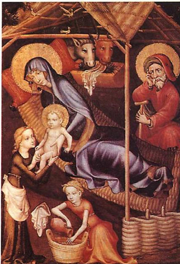
Narodzenie Chrystusa. Salzburg. Początek XVI w.