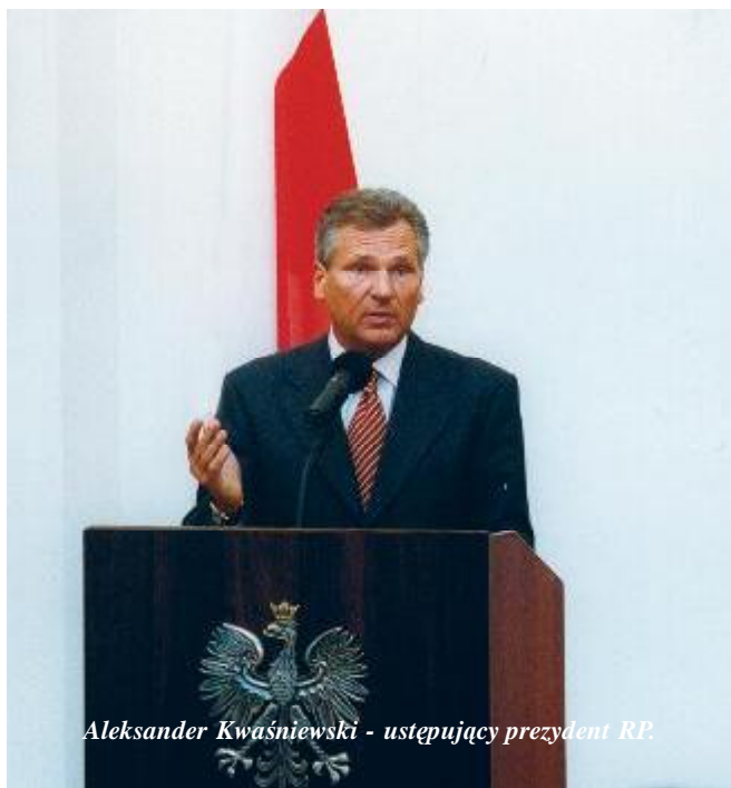
Aleksander Kwaśniewski - ustępujący prezydent RP.

Prezydent przywołał słowa niemieckiego kanclerza Gerharda Schroedera, że projekt nie jest wymierzony przeciwko komukolwiek, natomiast jego obowiązkiem podczas prac nad projektem była ochrona energetycznych interesów niemieckich. «Uważamy, że nie jest to argumentacja