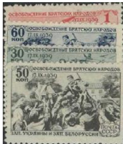
Znaczki radzieckie upamiętniające atak na Polskę w 1939 r.