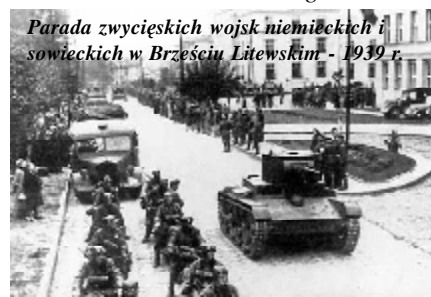
Parada zwycięskich wojsk niemieckich i sowieckich w Brześciu Litewskim - 1939 r.