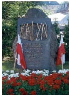
Jeden z wielu pomników ofiar katynia w Polsce.

W 66. rocznicę napaści Armii Czerwonej na Polskę członkowie Komitetu Katyńskiego rozszpali wokół Pomnika Ofiar Katynia w Warszawie ziemię przywiezioną z Katynia, Charkowa i Miednoje. Złożyli także wieńce oraz kwiaty. Upamiętnili w ten sposób tysiące Polaków, pomordo-