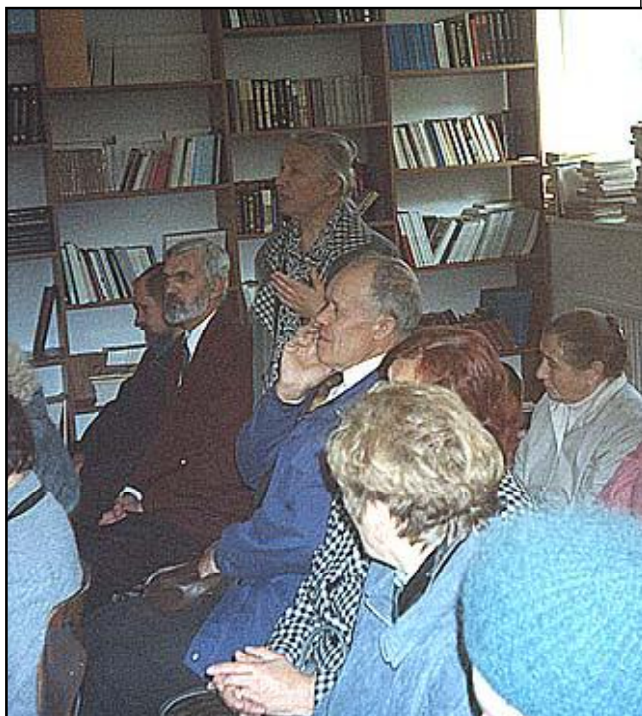
Podczas dyskusji.