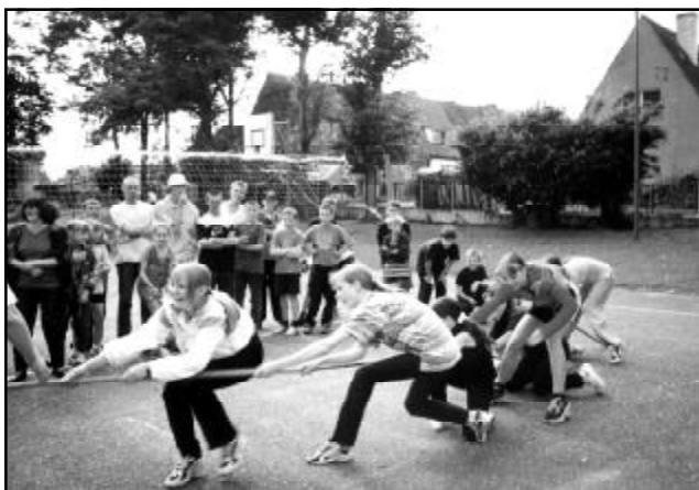
Na placu sportowym.