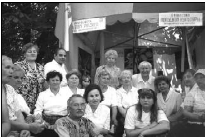
Przed „polskim” namiotem.