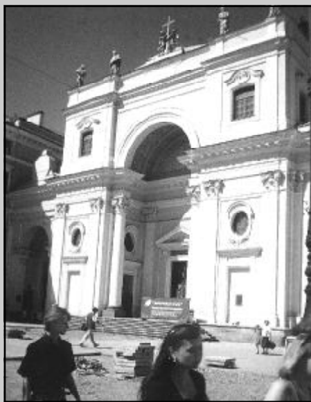
Kościół Katolicki na Newskim prospekcie w Sankt-Peterburgu w trakcie restauracji.