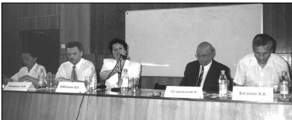
Prezydium seminarium.

W referacie przedstawiona była również krótka historia powstania powojennej Polonii Kaliningradzkiej, podkreślono wyjątkową rolę parafii katolickiej w uzyskaniu tożsamości narodowej przez Polaków zamieszkałych w Obwodzie Kaliningradzkim.