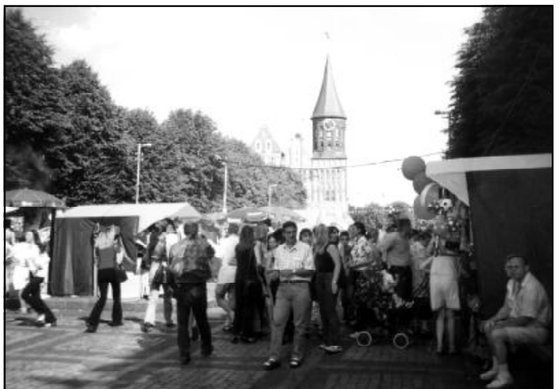
7 lipca na wyspie przed Katedrą.