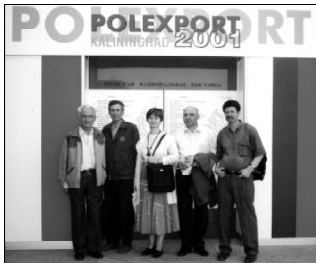
Przedstawiciele Polonii na wystawie POLEXPORT-2001.