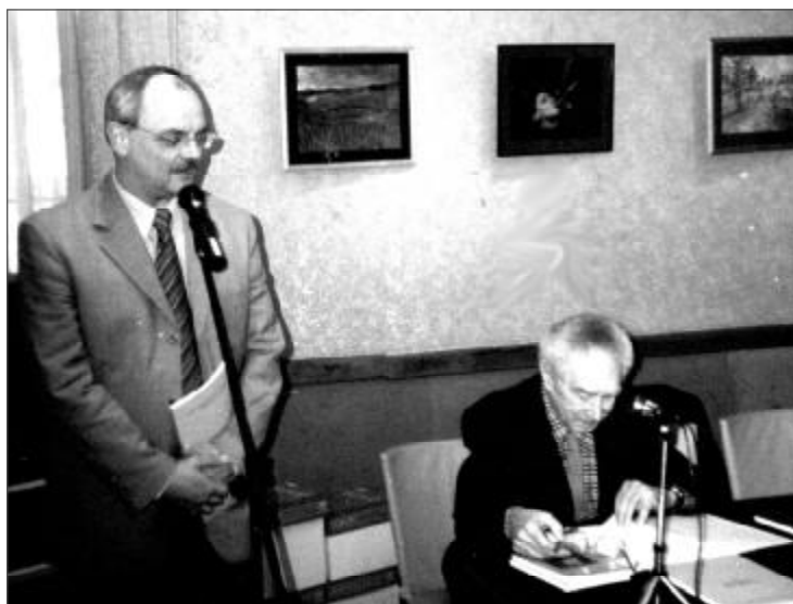
Konsul Generalny RP w Kaliningradzie przemawia podczas prezentacji wydania kaliningradzkiego klubu krajoznawców

hydrotechnicznych znajduje się na terenie obwodu kaliningradzkiego (autor krajoznawca Miłowski). Została zamieszczona również ciekawa lista polskich opracowań historycznych o dziejach z a k o n u