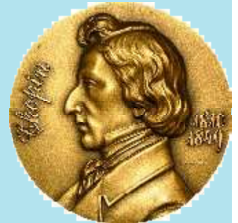
Medal poludniowoamarykański Chopina 2010 r.

Postać genialną w swojej istocie nie można dokońca scharakteryzować słowem. Całe swoje nat-