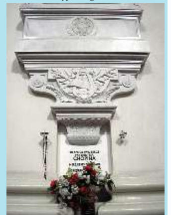
Epitaforium z sercem F. Chopina w kościele Sw. Krzyża w Warszawie

opracowanie i przekład z rosyjskiego W. Wasiliew